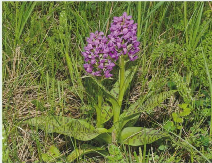
Aufblühende Dactylorhiza majalis

Lippe, die breiter als lang ist. Die Lippe hat eine dunkelrote Schleifenzeichnung. Der Sporn ist relativ dick, konisch und schwach abwärts gebogen. Nektar wird Insekten nicht angeboten (Nektartäuschblume). Der Austrieb erfolgt im zeitigen Frühjahr und die Blüte beginnt je nach Höhenlage Anfang Mai bis Anfang Juli.